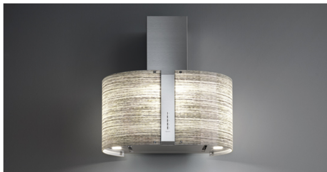
Фотографія призначена виключно в якості інформації Можже не відповідати обраній версії.

Тип установки Островна Покриття Шліфована нержавіюча сталь ( AISI 304 ) Скло Двигун 800 m 3 /h Тип керування Електронне керування Налаштування швидкості 4 Освітлення LED 4x1,2 W - 3200 K Навколишнє освітлення Периметральний світлодіод Фільтр Metallic filter "Base" - 277x294 mm Вугільний фільтр Круглий вугільний фільтр Ø170 мм - Тип 6 (включено) Мінімальна відстань Газова плита: 60 см Електрична плита: 52 см