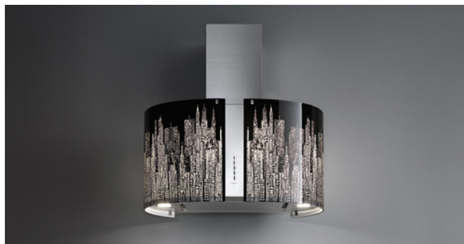
Фотографія призначена виключно в якості інформації Може не відповідати обраній версії.

Тип установки Настінна Покриття Шліфована нержавіюча сталь (AISI 304) Скло Двигун 800 m 3 /h Тип керування Електронне керування Налаштування швидкості 4 Освітлення LED 2x1,2 W - 3200 K Навколишнє освітлення Периметральний світлодіод Фільтр 2 x Metallic filter "Base" - 277x294 mm Вугільний фільтр Круглий вугільний фільтр Ø170 мм - Тип 6 (включено) Мінімальна відстань Газова плита: 60 cm Електрична плита: 52 cm