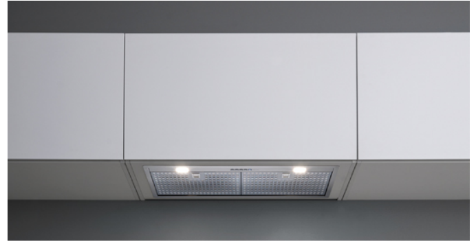
Das Bild dient rein einer groben Information. Es kann von der ausgewählten Version abweichen.