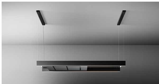
Das Bild dient rein einer groben Information. Es kann von der ausgewählten Version abweichen.