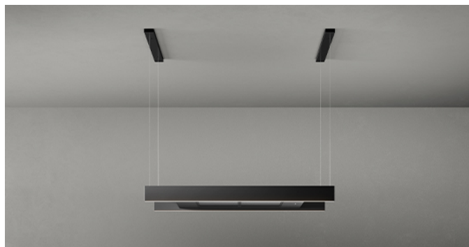
Immagine indicativa del prodotto Potrebbe non corrispondere alla versione selezionata