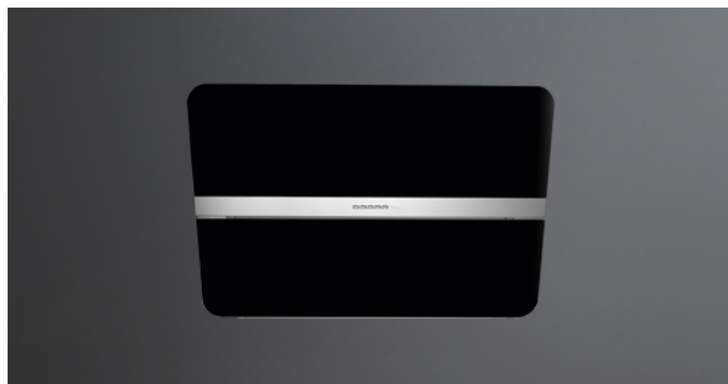
Fotografie cu caracter strict orientativ Aceasta poate sa nu corespunda versiunii selectate