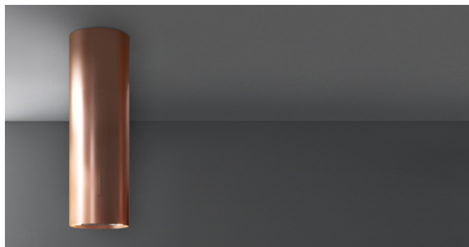
Immagine indicativa del prodotto Potrebbe non corrispondere alla versione selezionata