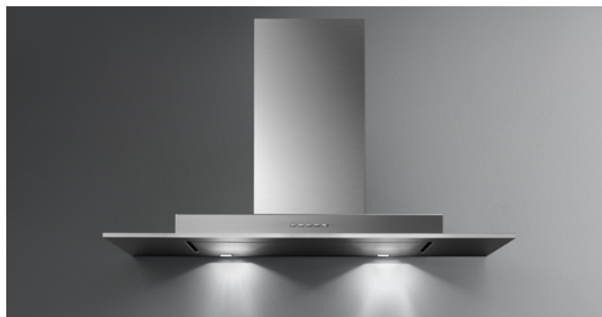
Фотография исключительно для информации Может не соответствовать выбранной версии.