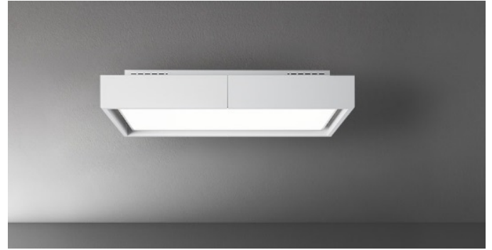
Photo à titre indicatif seulement Il ne peut pas répondre à la version sélectionnée