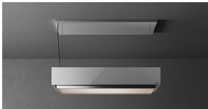
Фотография исключительно для информации. Может не соответствовать выбранной версии.