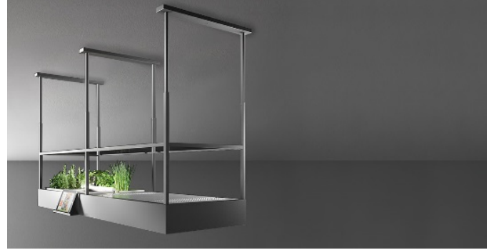
Das Bild dient rein einer groben Information. Es kann von der ausgewählten Version abweichen.