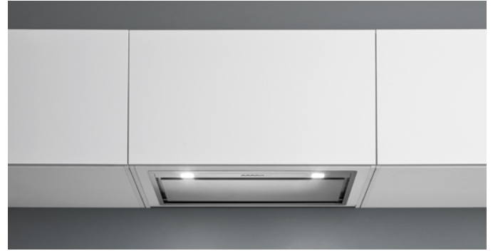
Das Bild dient rein einer groben Information. Es kann von der ausgewählten Version abweichen.