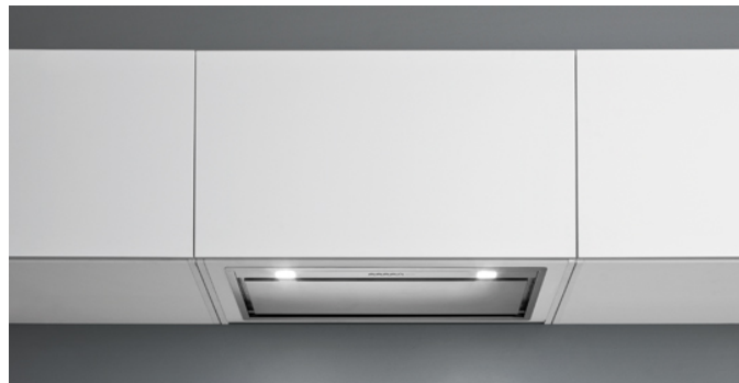
Photo à titre indicatif seulement Il ne peut pas répondre à la version sélectionnée