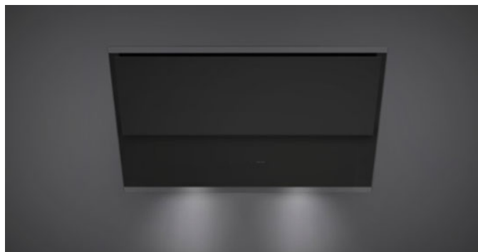
Фотографія призначена виключно в якості інформації Може не відповідати обраній версії.