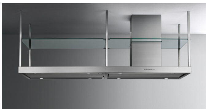
Фотография исключительно для информации Может не соответствовать выбранной версии.

Тип установки Островные Габаритные размеры 90 см Отделка Scotch brite Fasteel no finger prints Мотор 800 м 3 /h Тип управления Электронное управление Количество скоростей 4 Освещение Led 4x1,2 W - 3200 K Фильтр 2 x Metallic filter "Base" - 274x274 mm Угольный фильтр Square charcoal filter - Type 3 (Входит в комплектацию) Минимальное расстояние Газовая поверхность: 63 см Электр. поверхность: 52 см