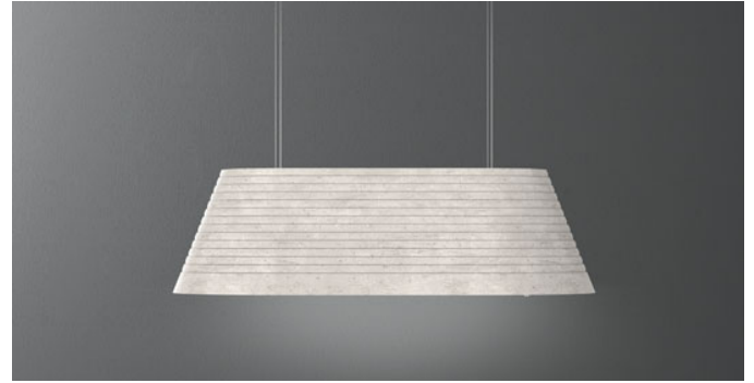
Photo à titre indicatif seulement Il ne peut pas répondre à la version sélectionnée