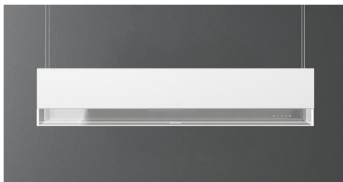
Immagine indicativa del prodotto Potrebbe non corrispondere alla versione selezionata