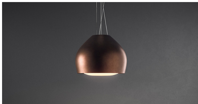
Fotografiet er udelukkende informativt Korresponderer ikke nødvendigvis tmed den valgte model