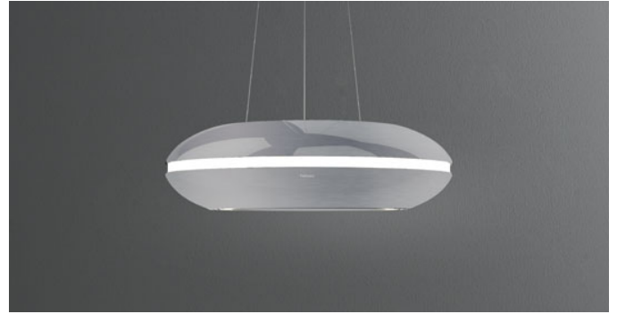
Photo à titre indicatif seulement Il ne peut pas répondre à la version sélectionnée