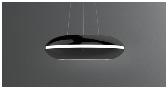
Фотография исключительно для информации Может не соответствовать выбранной версии.