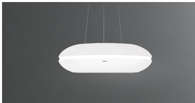
Immagine indicativa del prodotto Potrebbe non corrispondere alla versione selezionata