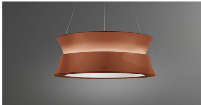
Poglądowe zdjęcie produktu Zdjęcie może dokładnie nie odpowiadać wybranej wersji