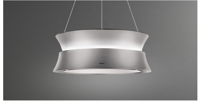
Das Bild dient rein einer groben Information. Es kann von der ausgewählten Version abweichen.