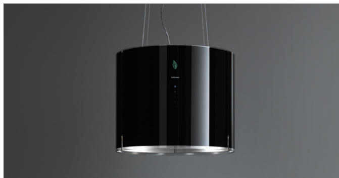
Immagine indicativa del prodotto Potrebbe non corrispondere alla versione selezionata