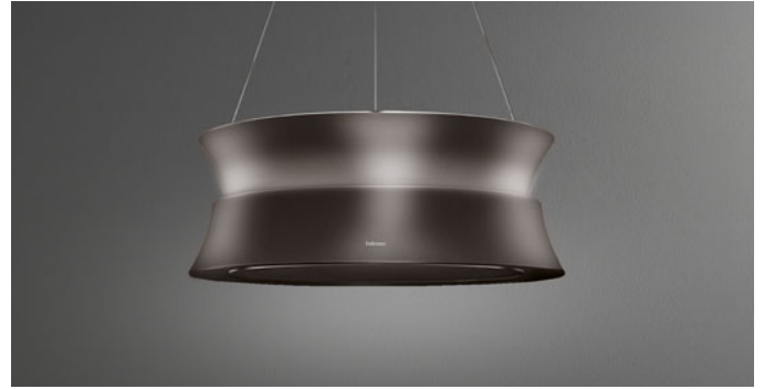
Photo à titre indicatif seulement Il ne peut pas répondre à la version sélectionnée