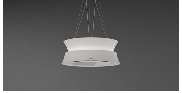
Fotoğraf tamamen bilgi amaçlıdır Seçili versiyona ait olmayabilir.