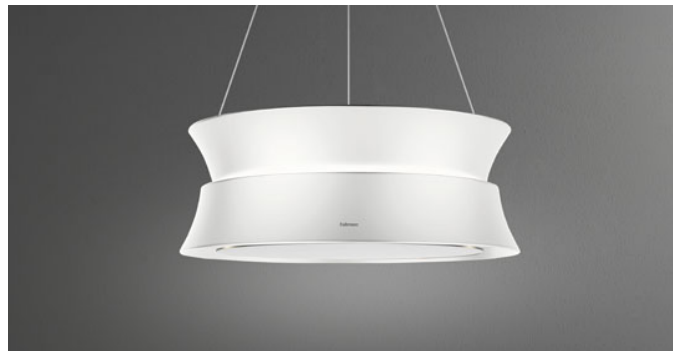
Poglądowe zdjęcie produktu Zdjęcie może dokładnie nie odpowiadać wybranej wersji