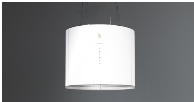
Photo à titre indicatif seulement Il ne peut pas répondre à la version sélectionnée