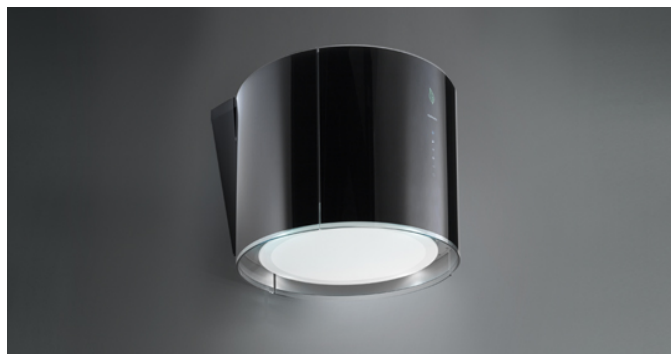
Photo à titre indicatif seulement Il ne peut pas répondre à la version sélectionnée