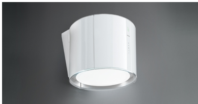
Photo à titre indicatif seulement Il ne peut pas répondre à la version sélectionnée