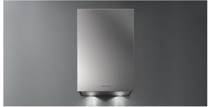
A fénykép csak tájékoztató jellegű Lehet, hogy nem felel meg a kiválasztott változatnak.