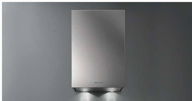
Фотографія призначена виключно в якості інформації Може не відповідати обраній версії.