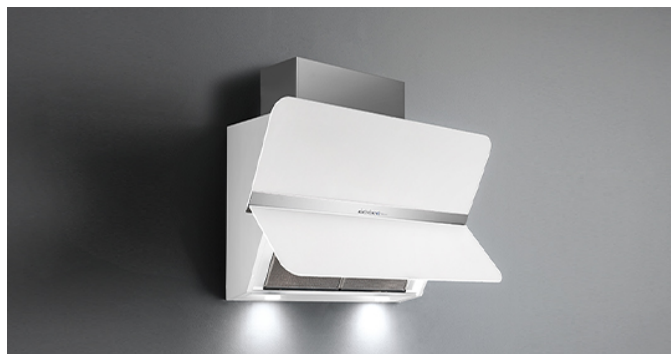
Фотографія призначена виключно в якості інформації Може не відповідати обраній версії.