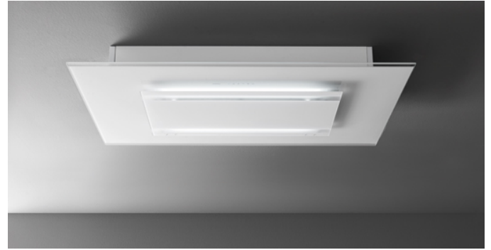
Photo à titre indicatif seulement Il ne peut pas répondre à la version sélectionnée