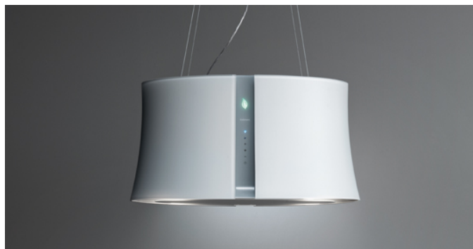
Фотографія призначена виключно в якості інформації Може не відповідати обраній версії.

Тип установки Островна Габарити 67 см Покриття Біле скло з матовим покриттям Двигун 450 m 3 /h Тип керування Сенсорне керування Налаштування швидкості 4 Освітлення LED 4x1,2 W - 3200 K Фільтр Metallic filter "Top" - 235x306 mm Вугільний фільтр Carbon.Zeo filters (включено) Мінімальна відстань Газова плита: 60 см Електрична плита: 52 см