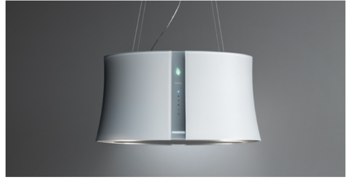
Das Bild dient rein einer groben Information. Es kann von der ausgewählten Version abweichen.