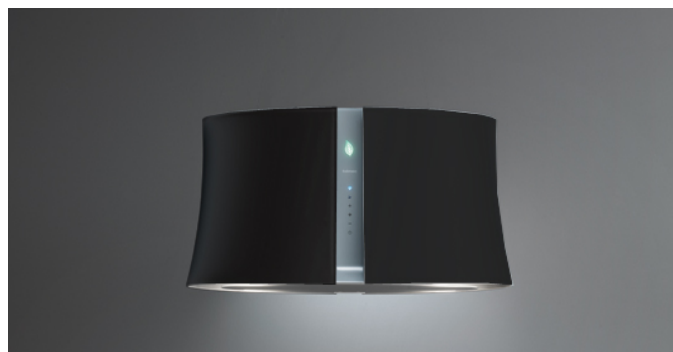
Poglądowe zdjęcie produktu Zdjęcie może dokładnie nie odpowiadać wybranej wersji