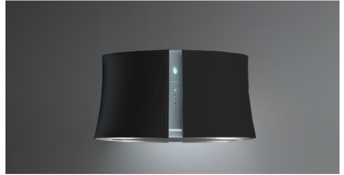
Das Bild dient rein einer groben Information. Es kann von der ausgewählten Version abweichen.