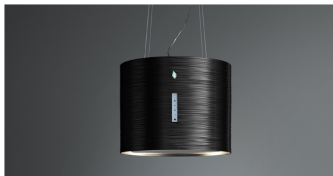
Immagine indicativa del prodotto Potrebbe non corrispondere alla versione selezionata