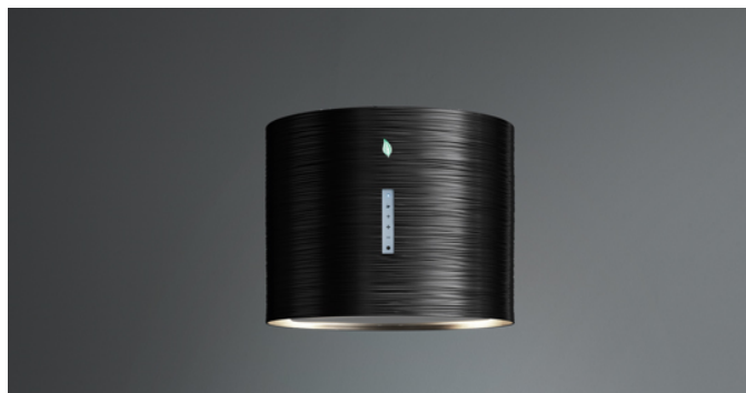
Immagine indicativa del prodotto Potrebbe non corrispondere alla versione selezionata