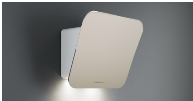
Фотографія призначена виключно в якості інформації Може не відповідати обраній версії.

Тип установки Настінна Габарити 80 см Покриття Фронтальна кольорова частина Хромована рама Двигун 800 м 3 /h Тип керування Електронне керування Налаштування швидкості 4 Освітлення LED 4x1,2 W – 3200 K Фільтр 2 x Metallic filter "Top" - Tab 60 Вугільний фільтр Круглий вугільний фільтр Ø170 мм - Тип 6 (включено) Мінімальна відстань Газова плита: 55 см Електрична плита: 52 см