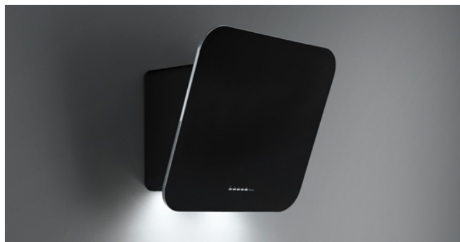
Фотографія призначена виключно в якості інформації Може не відповідати обраній версії.

Тип установки Настінна Габарити 60 см Покриття Фронтальна частина чорного кольору Хромована рама Двигун 800 м³/х Тип керування Електронне керування Налаштування швидкості 4 Освітлення LED 4x1,2 W – 3200 K Фільтр Metallic filter "Top" - Tab 60 Вугільний фільтр Круглий вугільний фільтр Ø170 мм - Тип 6 (включено) Мінімальна відстань Газова плита: 55 см Електрична плита: 52 см