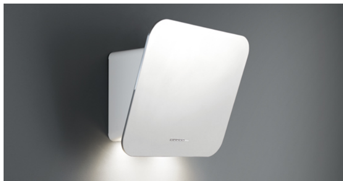
Фотографія призначена виключно в якості інформації Може не відповідати обраній версії.