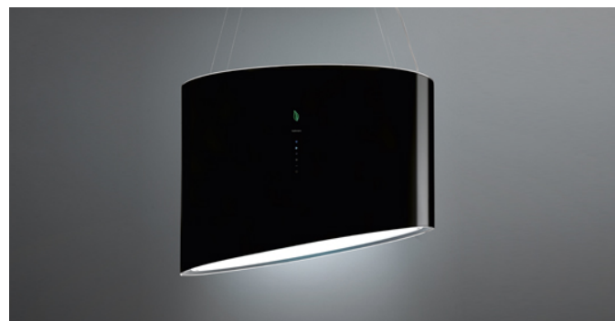
Immagine indicativa del prodotto Potrebbe non corrispondere alla versione selezionata