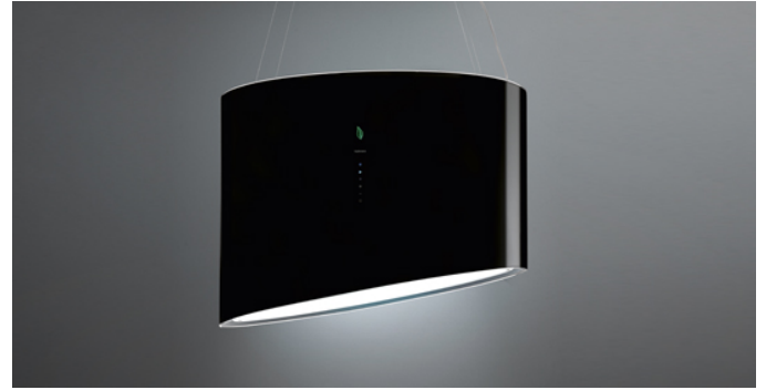
Photo à titre indicatif seulement Il ne peut pas répondre à la version sélectionnée