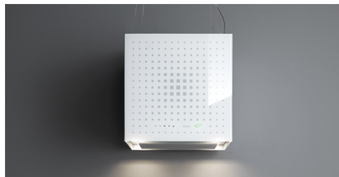
Poglądowe zdjęcie produktu Zdjęcie może dokładnie nie odpowiadać wybranej wersji