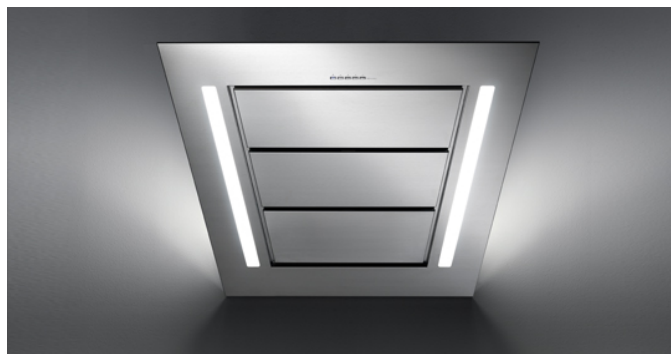
Фотографія призначена виключно в якості інформації Може не відповідати обраній версії.