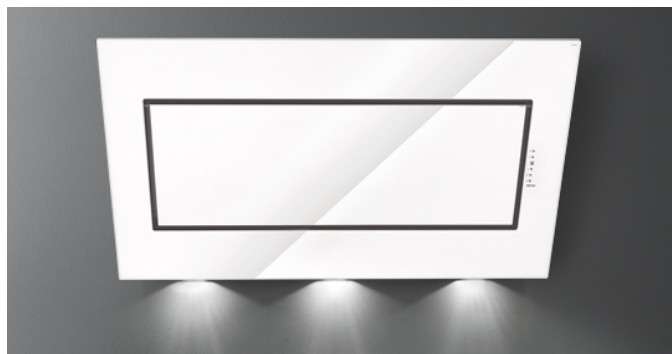
Фотографія призначена виключно в якості інформації Може не відповідати обраній версії.

Тип установки Настінна Габарити 120 см Покриття Покриття з білого загартованого скла Шліфована нержавіюча сталь Двигун 800 м³/х Тип керування Сенсорне керування Налаштування швидкості 4 Освітлення LED 3x1,2 W – 3200 K Фільтр 3 x Metallic filter "Base" - 290x326 mm Вугільний фільтр Круглий вугільний фільтр Ø170 мм - Тип 6 (додатково) Мінімальна відстань Газова плита: 57 см Електрична плита: 52 см