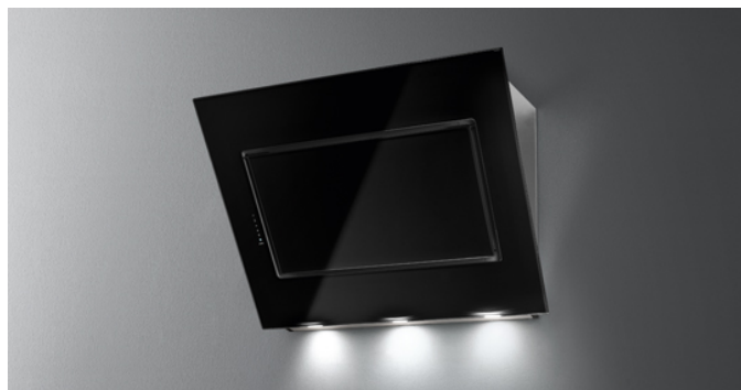
Фотографія призначена виключно в якості інформації Може не відповідати обраній версії.

Тип установки Настінна Габарити 90 см Покриття Покриття з чорного загартованого скла Шліфована нержавіюча сталь Двигун 800 м 3 /h Тип керування Сенсорне керування Налаштування швидкості 4 Освітлення LED 3x1,2 W – 3200 K Фільтр 2 x Metallic filter "Base" - 290x326 mm Вугільний фільтр Круглий вугільний фільтр Ø170 мм - Тип 6 (додатково) Мінімальна відстань Газова плита: 57 cm Електрична плита: 52 cm