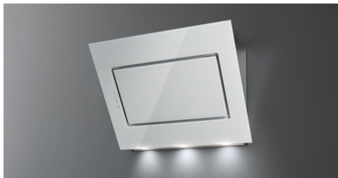
Фотографія призначена виключно в якості інформації Може не відповідати обраній версії.

Тип установки Настінна Габарити 60 см Покриття Покриття з білого загартованого скла Шліфована нержавіюча сталь Двигун 800 м³/х Тип керування Сенсорне керування Налаштування швидкості 4 Освітлення LED 2x1,2 W – 3200 K Фільтр 2 x Metallic filter "Base" - 278x301 mm Вугільний фільтр Круглий вугільний фільтр Ø170 мм - Тип 6 (додатково) Мінімальна відстань Газова плита: 57 cm Електрична плита: 52 cm